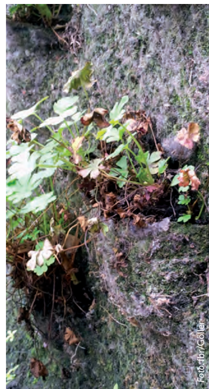
Die Pflanzen „sitzen“ in kleinen Taschen auf dem Vegetationsträger