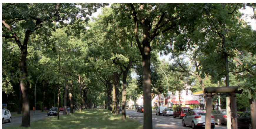
Straßenbäume sind in Städten ein wichtiges Element Grüner Infrastrukturen die durch Nachpflanzungen erhalten werden müssen.

Die Pflanze ist der zentrale „Werkstoff“ der Grünen Infrastrukturen, weil zahlreiche der Ökosystemdienstleistungen direkt oder indirekt durch die Vegetation erbracht werden. In Städten sind technische Maßnahmen notwendig, um trotz der sich überlagernden Nutzungen in den teilweise hochverdichteten Stadtquartieren, eine möglichst optimale Entwicklung der Pflanzen zu gewährleisten. Das sicherlich bekannteste Beispiel sind die Straßenbäume. Straßenbäume besitzen einen hohen stadtraumprägenden Wert, müssen aber oft mit geringem Wurzelraum auskommen und gleichzeitig an ihrem Standort den verschiedensten Anforderungen entsprechen. Für eine optimale Entwicklung der Pflanzen sind Verbesserungen des Sub-