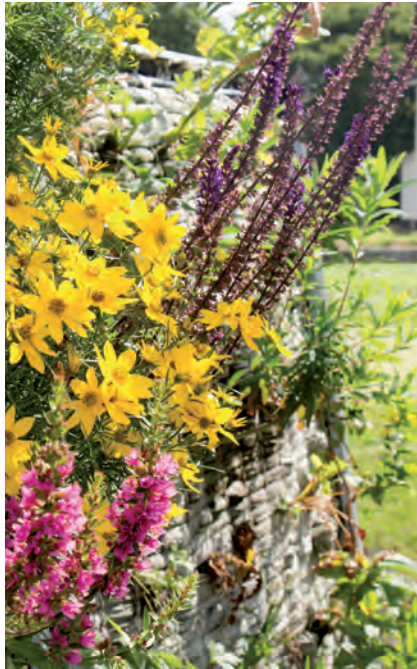
Versuche mit alternativen Pflanzenarten zur Anwendung auf wandgebundenen Systemen sollen die Eigenschaften und Wirkungen der einzelnen Arten genauer untersuchen..

Vegetationsträger befestigt, anschließend durchwachsen sie das Gewebe mit ihren Wurzeln. Die notwendigen Pflanzennährstoffe werden gemeinsam mit dem Bewässerungswasser über künstliche Bewässerungssysteme von oben in die Konstruktionen gegeben. Das Wasser durchfließt den Vegetationsträger von oben nach unten. Am unteren Ende wird überschüssiges Wasser in Rinnen wieder aufgefangen. Die wandgebundenen Systeme können je nach Architektur die gesamte Gebäudefassade oder auch nur Ausschnitte dieser einnehmen. Das bekannteste Beispiel ist sicherlich die „Mur Végétal“ von Patrik Blanc, nach dessen Vorbild in den letzten Jahren zahlreiche andere Systeme entwickelt worden sind. Alle Techniken ermöglichen eine ausschnittsweise bis vollständige Begrünung der vertikalen Flächen in kurzer Zeit, so dass neben der gestalterischen Absicht mit der Installation der Systeme auch die mit ihnen verbundenen Ökosystemdienstleistungen erreicht werden können.