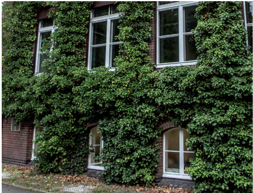
Bodengebundene Fassadenbegrünungen mit Kletterpflanzen (Gemeiner Efeu - Hedera helix ) erschließen vom Boden ausgehend vertikale Flächen mit Hilfe der verschiedenen Kletterstrategien der Pflanzen.

Trotz dieser hohen Potenziale wandgebundener Begrünungssysteme sind noch zahlreiche Fragen zu lösen. So